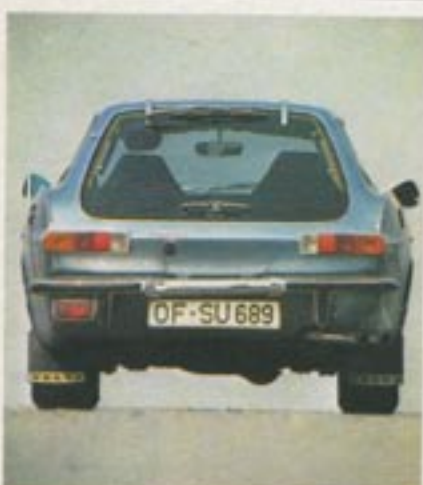
Faszinierendes Heck: klappbare Scheibe