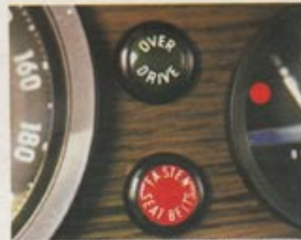
„Fasten Seat Belts“: An schnallzwang