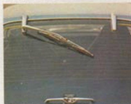
Heckscheibenwischer ist serienmäßig