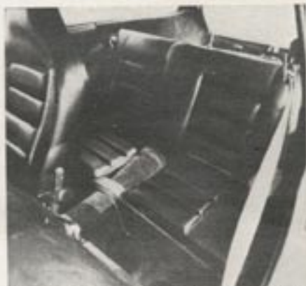
Rückbank: Wenig Platz, doch Einzelsitze

Die im Testwagen eingebaute Cassetten-Stereo-Anlage, eigens von Volvo