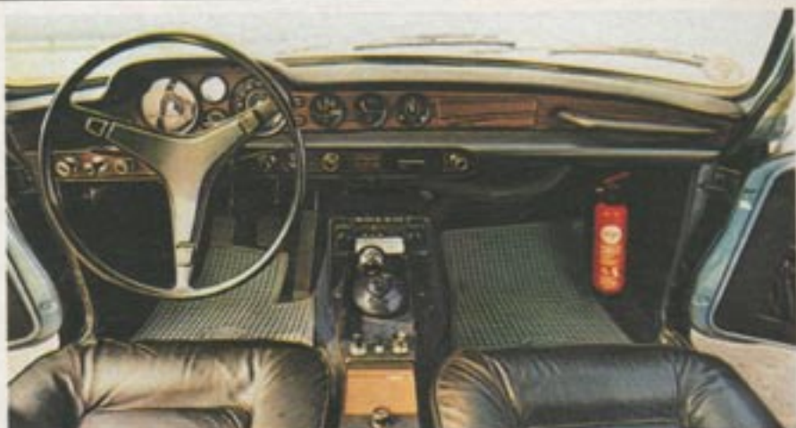
Leder, Holz und Rundinstrumente: Der Volvo 1800 ES hat ein sportliches Cockpit

Ungewöhnlich wird das Heck vor allem durch die riesige, schräggestellte Scheibe, die von einem serienmäßigen Wischer gereinigt wird und die bis tief