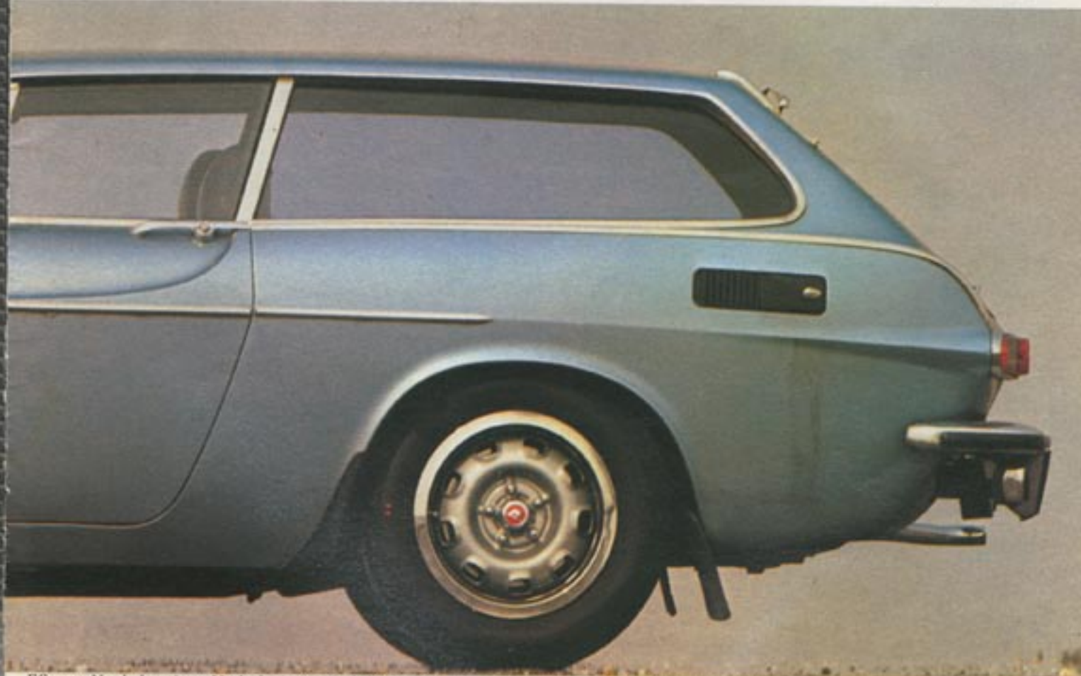
ES um. Nach heutigen Verhältnissen sind die Scheibenflächen zu klein, sie engen die Übersicht zu stark ein

Die Kombi-Operation hat dem Volvo-Coupé eine Menge zusätzlichen Stauraum eingebracht, doch leider verfügt der Wagen über keinen weiteren abdeckbaren Kofferraum. Zwar lassen sich jetzt auf der verglasten Stauffläche selbst sperrige Dinge unterbringen – in der Preisklasse ist wohl Golf- oder Jagdzubehör denkbar –, doch präsentiert sich das Gepäck wie in einem Schaukasten. Unter dem sehr hohen Boden des Freilicht-Kofferraums gibt es noch