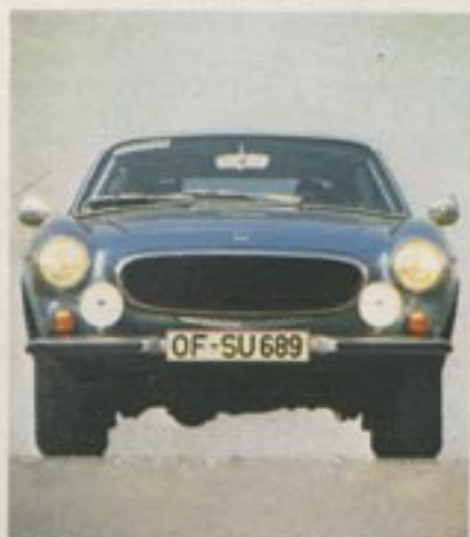
Seit Jahren unverändert: die Frontpartie